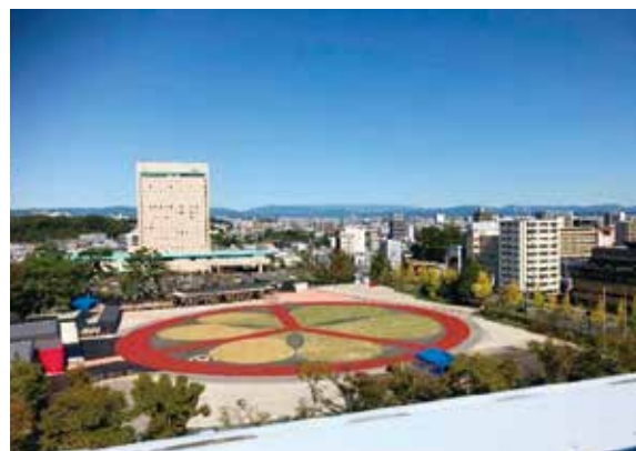
建設中の「大河ドラマ館」