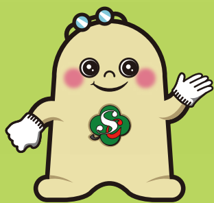
▲マスコットキャラクター「はまるん」